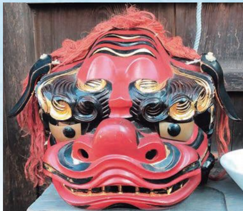
養老町 獅子頭(栗笠の獅子舞) (所蔵: 栗笠の獅子舞保存会)