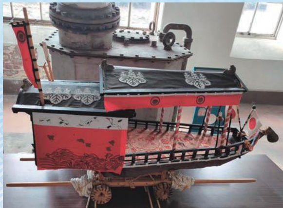
八百津町舟形だんじり(芦渡組) 模型 (所蔵: 八百津町教育委員会)

近年、新型コロナウイルスの影響によって、各地の祭りが縮小、中止されています。この展示を通して、来館者の皆様には、祭りの姿を再び想起いただければと思います。